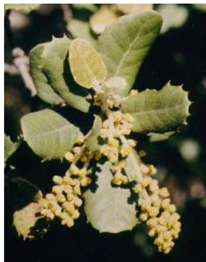
Chatons de fleurs mâles sur un Chêne vert.

Sur un même Chêne, les fleurs sont différentes selon leur sexe. Les mâles sont groupés en de longs chatons jaunes pendants. Les fleurs femelles sont isolées sur la tige. Elles vont donner un fruit sec, le gland, entouré à la base d'une cupule.