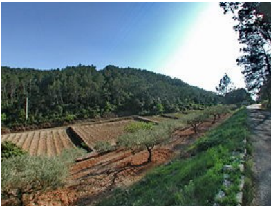
Restanques stricto sensu ou recavades au Thoronet (Var), barrant un vallon, avec écoulement latéral.

L'idée à retenir est que l'agriculteur provençal s'est attaché non seulement à aménager en terrasses les versants de collines mais aussi à combler les ravins (provoqués par les déboisements).