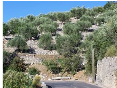
Oliviers « cailletiers » sur bancaous à Levens (Alpes-Maritimes).