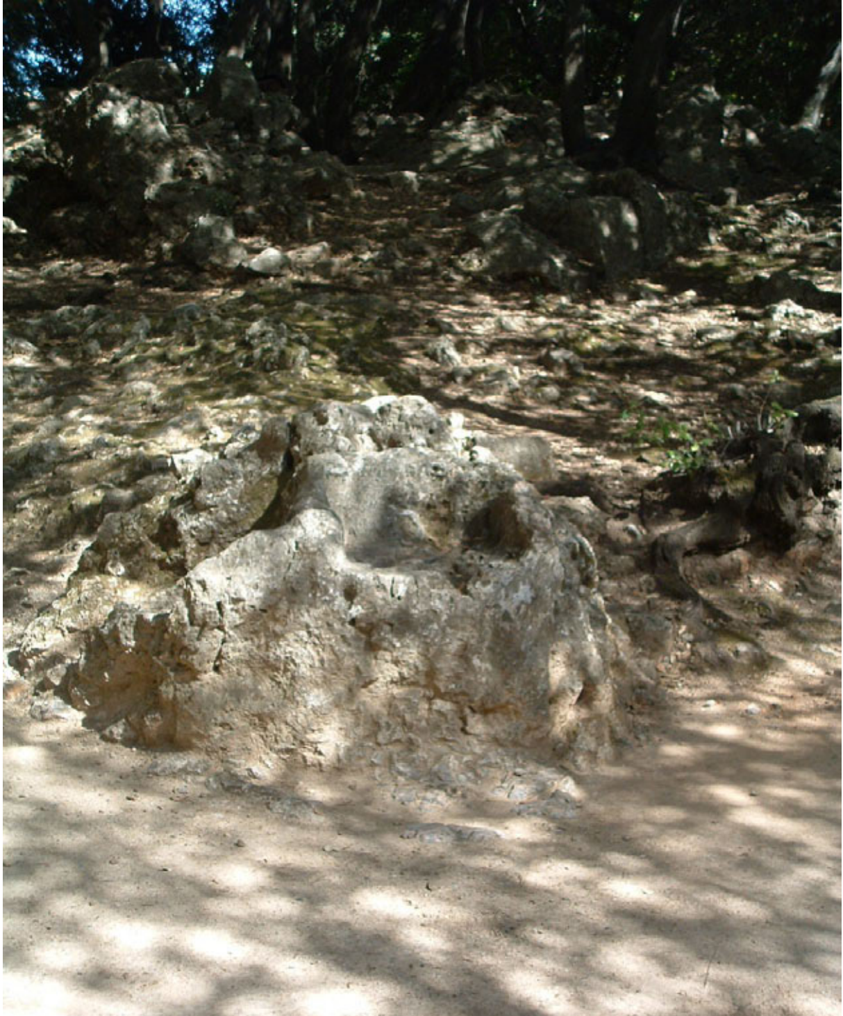
« Trône » de la princesse Pauline

La tradition veut que la Princesse Pauline Borghèse, séjournant à Grasse chez les Amic dans l'ancien hôtel de Pontevès (actuellement Musée International de la Parfumerie, situé sur le boulevard du Jeu de Ballon) soit venue se reposer dans ce jardin, sur un petit trône taillé dans un rocher durant l'hiver 1811, que vous trouverez dans le bois de chênes. Une table d'orientation, dominant le quartier de l'avenue Victoria, offre un beau panorama de la ville.